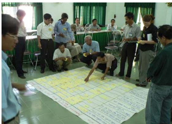
Các tham dự viên tham gia bài tập “matrix về sự tham gia của các thành viên dự án” tại Hội thảo xây dựng đề án khuyến nông có sự tham gia các tỉnh phía Nam . (Photo: Hoài Châu).

Xây dựng một phương thức khuyến nông mới đáp ứng nhu cầu và có hiệu quả, đóng vai trò như là một công cụ chính yếu cho phát triển nông nghiệp ở ĐBSCL, Việt Nam