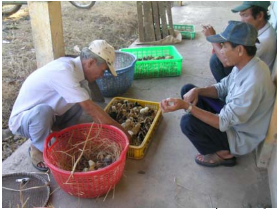
Nông dân tham gia thí nghiệm đang đếm và kiểm tra con giống trong ngày nhận giống gà, ngày 20/04/07.