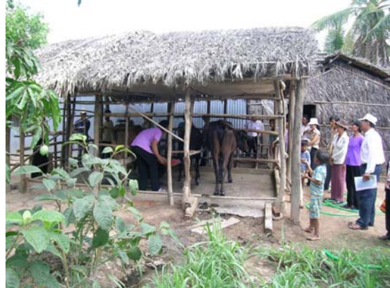
Nông dân CLB Trung Chánh tham quan mô hình trồng cỏ nuôi bò ở CLB Tam Sóc C1, tỉnh Sóc Trăng, ngày 22/03/2007.

bò con cho thành viên khác trong CLB nuôi” . CLB sẽ thực hiện xoay vòng để mỗi thành viên trong CLB cũng sẽ có giống bò lai Sind nuôi.