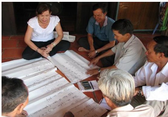
CBKN cùng nông dân họp chuẩn bị cho chuyến tham quan mô hình nuôi cá Chình, ngày 14/03/07.

Ngày 14/3/2007 CBDA và cán bộ TTKN Cà Mau đã đến theo dõi và quan sát thí nghiệm nuôi heo nái sinh sản đang trong giai đoạn chuẩn bị lên giống của 7 thành viên CLB tham gia thí nghiệm. Bên cạnh đó xác định lại nhu cầu của các thành viên CLB và họ quyết định thực hiện tiếp thêm một thí nghiệm nuôi cá Chình.