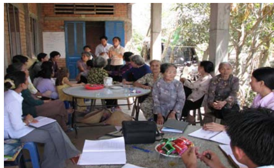
CLB họp xác định nhu cầu của CLB cho hoạt động năm 2007, ngày 10/03/2007.

Xuất phát từ tâm huyết của bà con nông dân CLB phụ nữ ấp 1, xã Long Cang, Cần Đước, Long An là muốn khôi phục lại một làng nghề trồng lác và dẹt chiếu của địa phương đã bị mai một cách đây không lâu, ngày 18/03/07 CBKN cùng CBDA đã tổ chức một chuyến tham quan cho 10 thành viên của CLB đi thăm mô hình trồng lác tại xã Trung Thành Đông, huyện Vũng Liêm, tỉnh Vĩnh Long. Tại đây, bà con được nông dân tỉnh bạn chia sẻ kinh nghiệm kỹ thuật trồng lác như cách bón phân, cách dùng thuốc, cách thu hoạch và phơi lác...nhằm tăng năng suất và lợi nhuận từ cây lác.