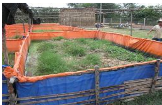
Mô hình nuôi Lươn tại trại thủy sản Sơn Ca, huyện Bến Lức, tỉnh Long An ngày 23/04/2007.