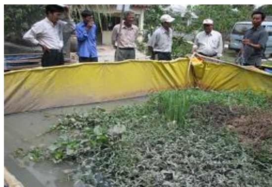
Nông dân quan sát và thảo luận về mô hình cùng chủ trại thủy sản Sơn Ca, huyện Bến Lức, tỉnh Long An ngày 23/04/2007.