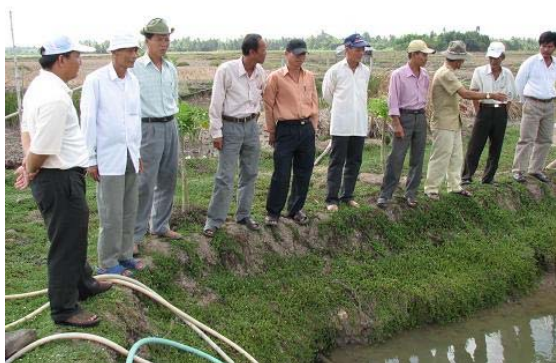
Nông dân CLB Tân Xuân tham quan mô hình nuôi cá Chình, ngày 31/03/07.

Ngày 31/3/2007, 10 thành viên trong CLB Tân Xuân đã đi tham quan mô hình nuôi cá Chình tại CLB Cánh Đồng 50 Triệu, xã Tân Thành, thành phố Cà Mau. Qua đây nông dân học hỏi và trao đổi kinh nghiệm lẫn nhau, học được cách đào ao, cách chọn con giống, thời điểm thả giống, cách xử lý đáy ao, phòng trị bệnh.... Nông dân CLB Tân Xuân rất phấn khởi và tăng thêm quyết tâm vào việc nuôi cá Chình khi họ tận mắt thấy mô hình và được hướng dẫn trao đổi tận tình. Ngày 13/4/2007, CLB họp để xác định hộ tham gia thí nghiệm và thiết lập các tiêu chí nghiệm nuôi cá Chình.