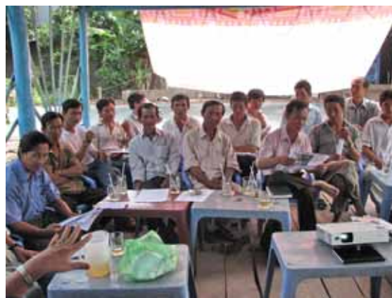
Sự tham gia nhiệt tình của các thành viên CLB Hội An, Chợ Mới, An Giang tại tập huấn, ngày 19/6/2007.

Vai trò của người lãnh đạo CLB: người lãnh đạo CLB có vai trò tối quan trọng, nó ảnh hưởng lên tất cả các hoạt động của CLB và quyết định sự thành công của CLB. Một lãnh đạo CLB thành công cần hội đủ một số yếu tố sau: (i) năng động, có tinh thần đổi mới, có tính quyết đoán, dám nói dám làm và nhiệt tình, (ii) gương mẫu, giữ chữ tín, đi tiên phong trong các hoạt động phong trào và áp dụng các tiên bộ khoa học kỹ thuật, (iii) quan tâm đến các thành viên, tìm giải pháp giúp đỡ các thành viên gặp khó khăn, và (iv) gắn bó mật thiết với các thành viên tăng tình đoàn kết trong CLB, nhiệt tình hướng dẫn truyền đạt lại cho các thành viên khác chưa nắm rõ về một vấn đề nào đó, tạo được lòng tin của các thành viên trong CLB.