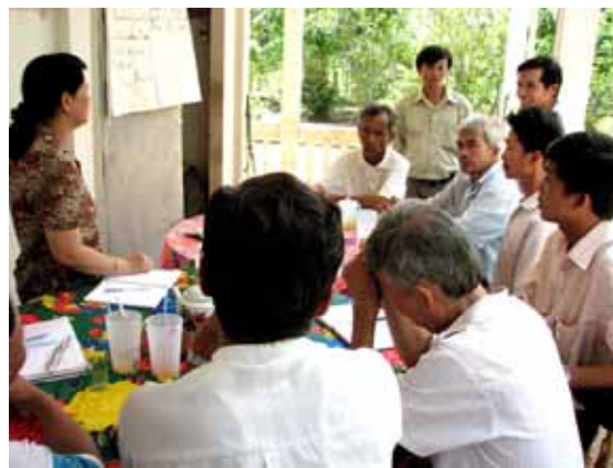
Nông dân CLB ấp Sóc Ruộng họp ngày 18/5/2007

và quyết định các vấn đề cần giải quyết là: (1) nuôi heo kết hợp với nuôi cá, và (2) nuôi gà kết hợp với nuôi cá nhằm tận dụng nguồn thức ăn sẵn có để làm tăng thêm nguồn thu nhập. TTKN tỉnh sẽ hỗ trợ giống cá đối với 1 trong 2 mô hình trên và dự án MDAEP sẽ kết hợp với TTKN cùng hỗ trợ, thiết lập thí nghiệm và tập huấn kỹ thuật cho nông dân. CLB sẽ chọn thành viên tham gia thí nghiệm và lập kế hoạch cụ thể cho bước thực hiện thử nghiệm tại CLB.