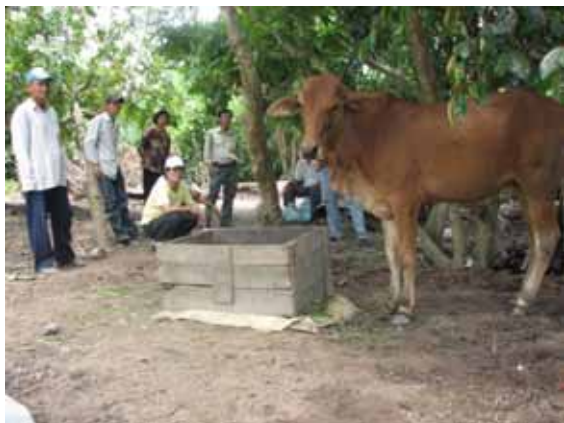
CBKN, CBDA cùng nông dân quan sát đánh giá tình trạng bò sau khi mua về, Vũng Liêm ngày 9/5/2007.

Ngày 09/05/07, CLB xã Trung Chánh đã họp và thực hiện giám sát theo dõi thí nghiệm nuôi bò lai Sind với sự tham gia của Dự án và CBKN Trạm. Kết quả cho thấy các thí nghiệm viên thực hiện thí nghiệm rất tốt, theo đúng qui cách thí nghiệm. Về 5 con bò thí nghiệm phát triển bình thường, trong đó có 3 con đang chuẩn bị sinh sản và 2 con đang chờ phối giống. Trong buổi họp này, CLB đã thông qua các thỏa thuận về quản lý thực hiện thí nghiệm của các thí nghiệm viên: (1) Mỗi thành viên tham gia sẽ phải thực hiện đúng theo các yêu cầu về kỹ thuật và khi có vấn đề phát sinh phải báo ngay cho CLB, CBKN và Dự án biết để tìm biện pháp giải quyết, và (2) khi bò mẹ sinh bê con đầu tiên, thí nghiệm viên nuôi tiếp đến khi bê con được 8 tháng tuổi và nhường lại cho thành viên khác trong CLB chưa có bò với giá thấp bằng một nửa giá hiện hành. Việc làm này nhằm tạo cơ hội cho mọi thành viên CLB cùng chia sẻ kết quả thí nghiệm của CLB và những hỗ trợ của Dự án.