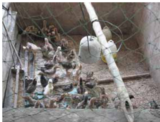
Đàn gà thí nghiệm của CLB đang phát triển tốt

Sau gần 1 tháng thực hiện thí nghiệm nuôi gà Tàu thả vườn, ngày 08/05/07 CLB nông dân Bình Nhì đã tiến hành họp để giám sát thí nghiệm và kết hợp tập huấn đợt 2 về kỹ thuật chăn nuôi gà Tàu thả vườn. Kết quả theo dõi: đàn gà phát triển tốt, tuy nhiên mức độ lẫn tạp với các loại gà khác như gà Tam Hoàng, Lương Phượng là khá cao (khoảng 30%). Tỷ lệ hao hụt 7-10% nguyên nhân chủ yếu là gà con bị viêm cuốn rốn và chết. Nông dân đã học tập và chia sẻ qua hoạt động giám sát này. Theo CBKN, trong tháng đầu tiên khi gà con mới bắt về nuôi rất mất cảm với điều kiện môi trường thay đổi nên cần theo dõi quan sát tình trạng gà thường xuyên, ủ ấm và cho gà ăn đầy đủ chất dinh dưỡng nhằm hạn chế mức hao hụt đàn gà.