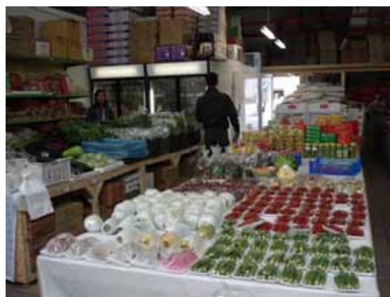
Quầy rau, quả bày bán rất "bắt mắt" khách hàng tại chợ Đông Xuân, Berlin, ngày 7/6/2007

Khu chợ nằm ở phía Đông Berlin, cách trung tâm thành phố 30 phút đi bằng xe buýt hoặc xe Tram - một loại phương tiện giao thông công cộng ở Âu Châu. Chợ gồm có ba gian mỗi gian dài khoảng 100 m ngang chừng 20 m, bên trong mỗi gian độ chừng 40-50 quầy hàng. Khi vào khu vực chợ là bạn có thể nghĩ rằng mình đang ở Việt Nam, trên 90% là người Việt ở đây, người ta bày bán đủ thứ nhưng đa số các quầy là quần áo, giày dép và nông sản thực phẩm Á Châu. Ở các quầy nông sản thực phẩm, bạn có thể mua hầu như mọi thứ rau tươi, hoa quả ở Việt Nam mình có như rau muống, cải bẹ xanh, đậu bắp, ngò, chuối, dưa hấu, mít, thanh long, xoài, ... Về thực phẩm chế biến thì đủ loại và có thể nói là đa dạng hơn nhà mình. Ngoài các loại thủy sản đông lạnh như cá tra, cá basa, cá lóc, rô đồng, tôm sú, mực,... bạn cũng có thể mua cả cua, và ốc đồng (còn sống)! Rau quả đóng hộp và nước trái cây thì muôn vàn, nhưng có điều làm tôi thắc mắc là hầu hết các loại này lại là "Made in"... Thái Lan, kể cả gạo cũng thế!