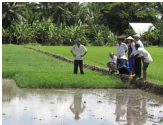
CBKN hướng dẫn nông dân trực tiếp trên đồng ruộng

giống lúa Hàm Trâu nguyên chủng từ nguồn giống Hàm Trâu mà các thành viên CLB đã có từ các thí nghiệm năm 2006. Thí nghiệm được tiến hành theo phương pháp gieo mạ cấy với diện tích 1000m 2 dưới sự hướng dẫn kỹ thuật của CBKN trạm KN Cầu Kè và cán bộ của Viện NCPT ĐBSCL. Ngày 02/05/07, CBKN đã đến hướng dẫn bà con kỹ thuật cấy, các biện pháp phòng trừ sâu bệnh và kỹ thuật phân bón. Dự kiến đến giai đoạn lúa đẻ nhánh CLB sẽ tổ chức tập huấn về cách nhận dạng cây lúa đúng giống và cách khử lẫn.