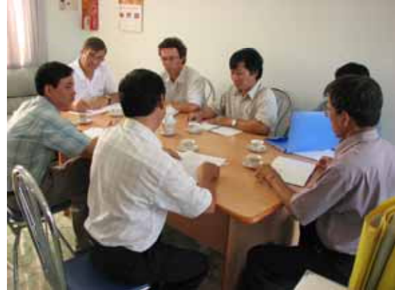
Phái đoàn chuyên gia đánh giá đang thảo luận và trao đổi tại TTKN An Giang, ngày 13/6/2007.

lãnh đạo của các Sở Nông Nghiệp và Trung Tâm Khuyến nông 3 tỉnh nói trên về dự án. Kết thúc chuyến đi, nhóm chuyên gia đã có nhận xét đánh cao về hiệu quả cũng như những đóng góp của dự án MDAEP cho hoạt động khuyến nông ĐBSCL. Sau chuyến đi này, nhóm chuyên gia đánh giá sẽ có báo cáo phản hồi cho VVOB và dự án MDAEP. Kết quả đánh giá này cũng sẽ làm cơ sở triển vọng cho dự án Khuyến nông có sự tham gia giai đoạn tiếp theo.